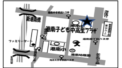
プラリバへの地図